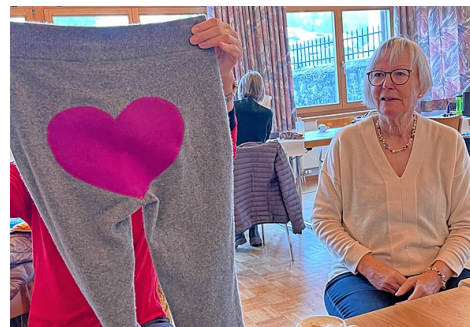
Die «ReparierBar» ist am Samstag wieder in Saas zu Gast.